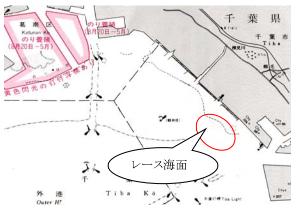
レース海面位置図